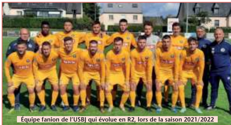
Équipe fanion de l'USBJ qui évolue en R2, lors de la saison 2021/2022

Toutes les personnes désirant pratiquer le football sous les couleurs de l'USBJ, peuvent contacter : Franck Taburet au 07 81 99 15 70 Stéphane Couillard au 06 99 02 20 0