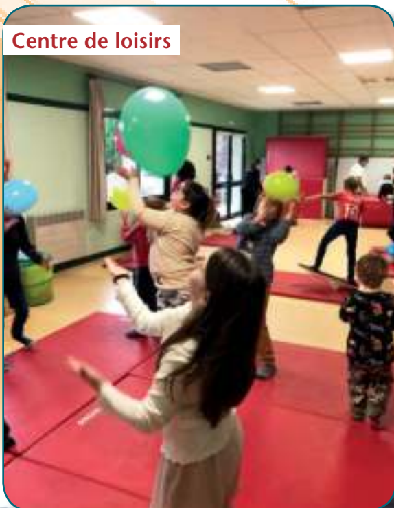
Centre de loisirs