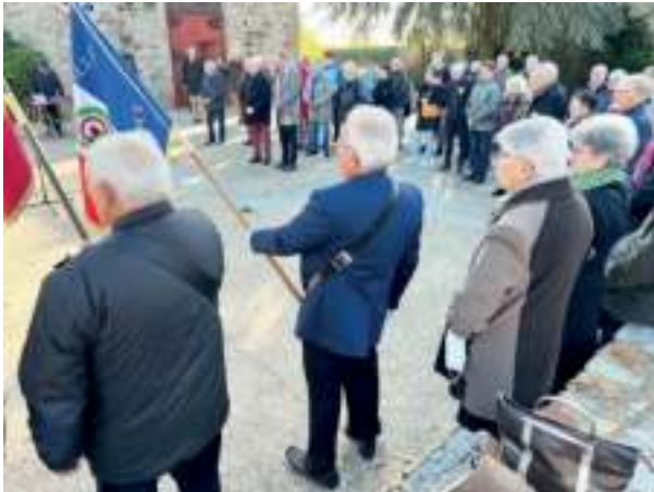
La section de l'Union nationale des combattants et la municipalité ont commémoré l'Armistice du 11 novembre 1918