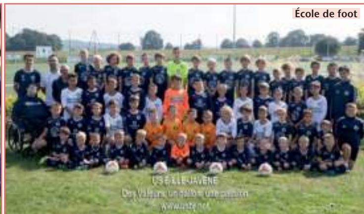
École de foot