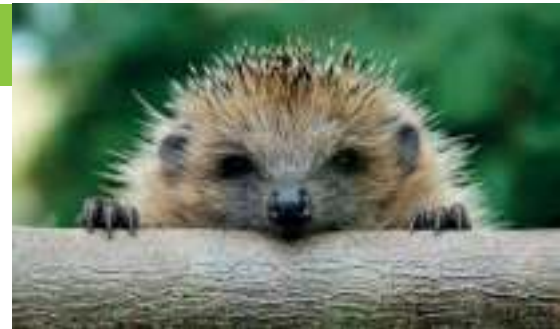
Passage à hérisson